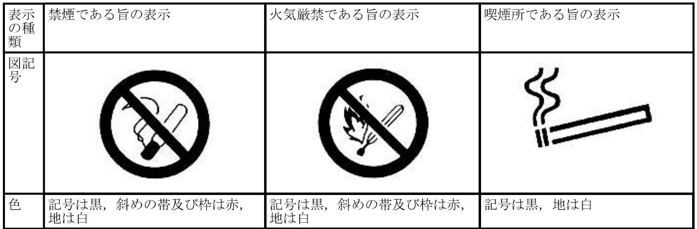
別表第8(第34条, 第35条, 第35条の2, 第56条関係)